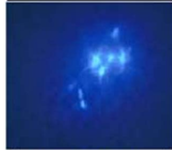
Núcleo ambíguus ,D Choi