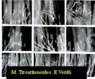
M. Thyroaritenideo. E Verbi