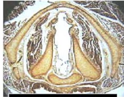
Pliegues vocales rata. E Marañillo